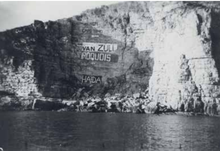
Namen van schepen op een rots bij Yong Pyong Do ter herinnering aan hun deelname aan het VN-detachement in Korea (NIMH)

maet bij Wonju in de nacht van 14 op 15 februari 1951, wederom met zware verliezen, de strategisch belangrijke heuvel 325 op de Chinezen te heroveren. Uiteindelijk stabiliseerde het front zich rond de 38 ste breedtegraad, de huidige grens tussen Noord- en Zuid-Korea. De strijd ontwikkelde zich daarna tot een bloedige stellingenoorlog die deed denken aan de Eerste Wereldoorlog. Uiteindelijk eindigde de gewapende strijd op 27 juli 1953 met een wapenstilstand die voortduurt tot op de dag van vandaag. Triest detail: op de dag vóór de wapenstilstand, dus op 26 juli, liep een KL-patrouille in een Chinese hinderlaag, waarbij nog eens vijf Nederlandse militairen sneuvelden.