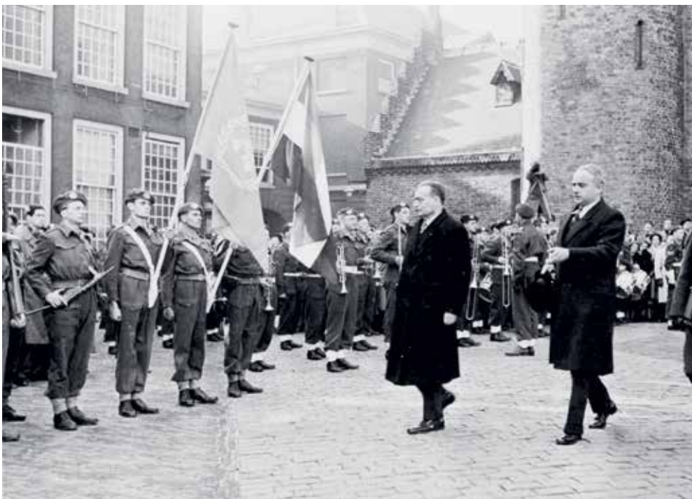
Minister-president Willem Drees inspecteert op het Binnenhof het Nederlands Detachement Verenigde Naties voor vertrek naar Korea

Zoals gezegd, ook de Koninklijke Marine leverde een aandeel aan de strijd in Korea. 6 Uiteindelijk gaven zes torpedobootjagers en fregatten met aan boord ruim 1300 bemanningsleden onder Brits commando 7 acte de présence in de wateren aan vooral de westkant van het Koreaanse schiereiland. Dat begon op 3 juli 1950 met het besluit van de regering om Hr.Ms. Evertsen in te zetten. Het schip was op dat moment in het kader van de Nederlands-Indonesische Unie in de archipel gestationeerd en kwam medio juli in Korea aan. Daar kende het een ongelukkige start toen het, na een aantal gevechtspatrouilles, op 9 augustus in de Gele Zee met de voorstevan op een rif liep. Het resulteerde in een enorme scheur en een aantal compartimenten liep vol water. Door snel luiken en deuren te sluiten kon worden voorkomen dat een nog groter deel van het schip onder water kwam te staan. Ondanks het gebruik van pompen maakte het schip slagzij naar bakboord. Toen commandant LTZ1 Damiaan Joan van Doorninck Azn een noodsein uitzond, voeren drie Britse schepen naar de Evertsen en namen het schip op sleeptouw. Enkele dagen na het incident arriveerde het in de haven van Sasebo in Japan.