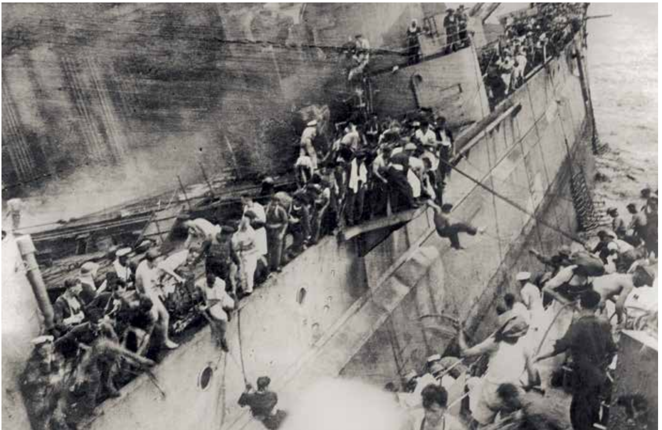
10 December 1941: de Britse jager HMS Express (rechts) neemt evacuees van het zinkende slagschip HMS Prince of Wales aan boord. Het zinken van de Prince of Wales tezamen met de slagkruiser HMS Repulse was een enorme klap voor de Britse strijdkrachten en de verdediging van Singapore

Terwijl de Koninklijke Marine de vijand blijft opzoeken, moppert het Britse publiek niet alleen over de eigen maritieme onzichtbaarheid in de regio, maar vraagt het zich ook af waar de U.S. Navy blijft. 16 Wanneer de Amerikaanse presentie in de regio in de loop van januari lijkt te groeien, telt de pers in sommige gevallen de Amerikaanse en Nederlandse prestaties bij elkaar op en presenteert deze als samenwerking. Een voorbeeld hiervan is te vinden in onder meer de Yorkshire Post van 28 februari 1942. De krant brengt op de voorpagina, naast een aankondiging van een nog ongespecificeerde 'naval battle' in de Javazee, een overzicht van de Japanse verliezen ter zee in de voorgaande maanden: 'One enemy capital ship has been sunk and three damaged, seven cruisers sunk, eight seriously damaged and twelve damaged, and two aircraft carriers damaged (one seriously). In addition 79 transport and merchant ships have been sunk.' Deze geallieerde