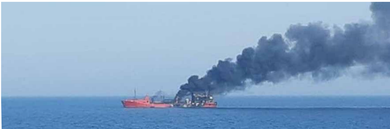
Het civiele vaartuig Millennial Spirit voer onder Moldavische vlag, toen het op 25 februari 2022 werd getroffen door granaten van vermoedelijk Russische oorlogsschepen

onderweg van Oekraïne naar Constanta (Roemenië) toen zij onderschept werden in de territoriale zee van Roemenië. De schepen zijn naar Sebastopol overgebracht. Het zeeoorlogsrecht staat toe dat civiele scheepvaart van de tegenstander in beslag mag worden genomen. Aangezien dit, anders dan bij buit ingeval van militair materiaal, om civiele schepen gaat, wordt vereist dat de rechtmatigheid van inbeslaggenomen vijandelijk gevlagde koopvaardij-schepen aan een rechterlijke instantie (prijsgerecht) wordt voorgelegd om de rechtmatigheid van de inbeslagname te toetsen. Het instellen van een prijsgerecht komt maar sporadisch voor. Voorbeeld zijn blokkadebrekers die de afgelopen jaren door Israël in beslag zijn genomen (waaronder een Nederlands gevlagd schip 26 ) en vervolgens ook voor een prijsgerecht gekomen. Het proces van prijsverklaring is door de rechter weliswaar ongebruikt, maar daardoor niet onverplicht geworden. Zou Rusland de schepen rechtmatig willen toe-eigenen, dan zouden de schepen moeten worden prijsverklaard.