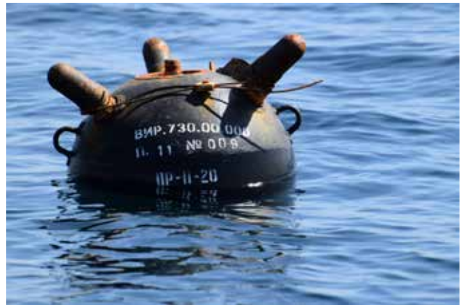
Afbeelding van de losgeraakte zeemijn in Roemeense wateren. Zowel Rusland als Oekraïne hebben dit type mijn in het arsenaal, waardoor onduidelijk is wie de mijn gelegd heeft

We zien ook dat de term 'blokkade' in dit verband wordt gebruikt. Hoewel de scheepvaart klem zit, is momenteel geen sprake van een blokkade in zeeoorlogsrechtelijke zin. Zou dat wel het geval zijn, dan kon Rusland gebruik maken van bevoegdheden om schepen die de blokkade proberen te doorbreken, eventueel met geweld, te stoppen en in beslag te nemen. Maar daarvoor moet een blokkade eerst deugdelijk zijn afgekondigd 9 en bovendien