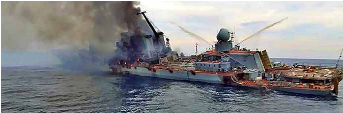
Het zwaar beschadigde oorlogsschip Moskva vlak voordat zij zonk, 15 april 2022

scheper. Midden april zonk het Russische oorlogsschip Moskva na beschadigd te zijn door vermoedelijk Neptune anti-ship raketten vanaf de kust en eerder werd een Russische patrouilleboot beschadigd door beschietingen vanaf de kust. Wel is sprake van het uitvoeren van aanvallen vanuit zee op landdoelen. 34 De persvoorlichter van het Pentagon stelde op 21 maart: 'We have seen indications that some of the bombardment around Odessa is coming from the sea from surface combatants. I couldn't tell you exactly what munitions and how many and what they're hitting.' 35 Volgens hem hebben ook landingen vanuit zee nabij Marioepol plaatsgevonden. 36