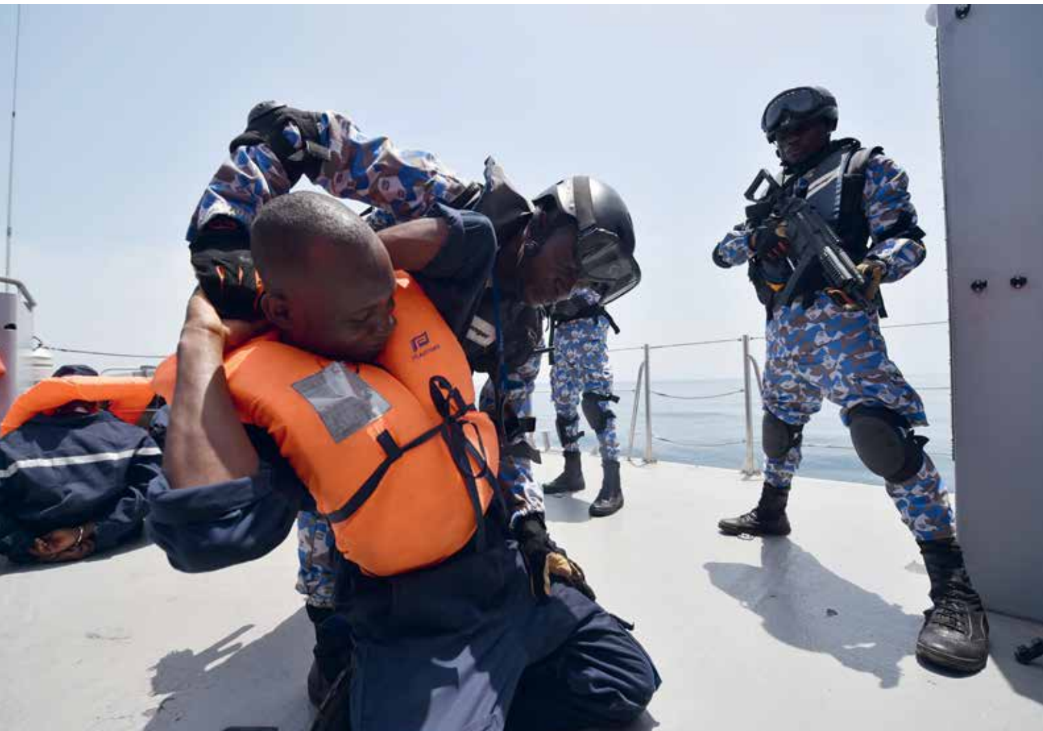
Ivoorse interventietroepen fouilleren een persoon tijdens de oefening Obangame Express 2017