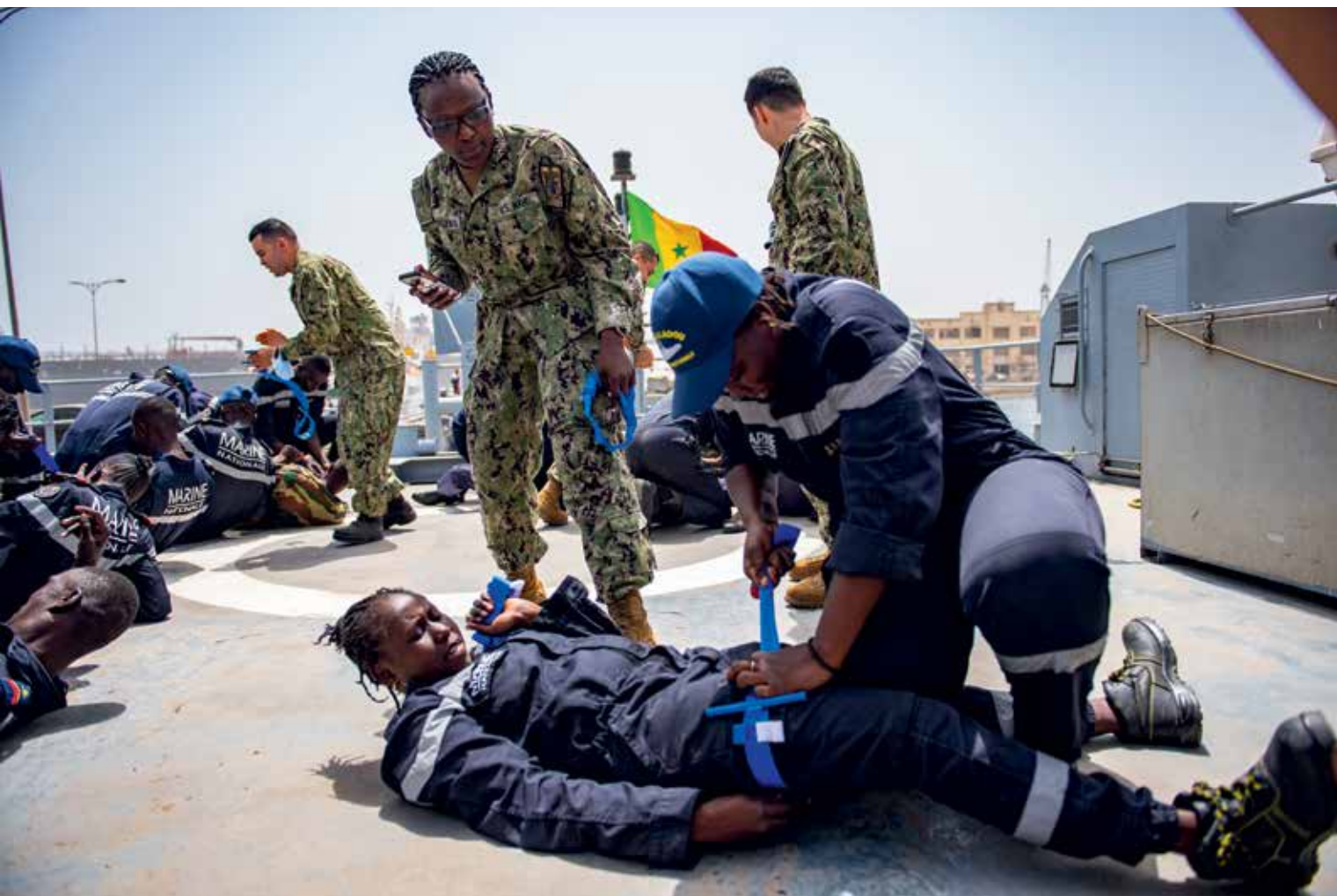
Medisch personeel van de US Navy traint Senegalese matrozen

PAWA kan worden gezien als een Westers antwoord op Afrikaanse problemen. Afrikaanse antwoorden op Afri-