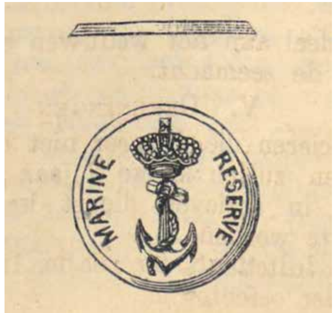
Afbeelding van het Onderscheidingsteken der Koninklijke Marine Reserve afkomstig van de Nederlandsche Staatscourant uit 1894