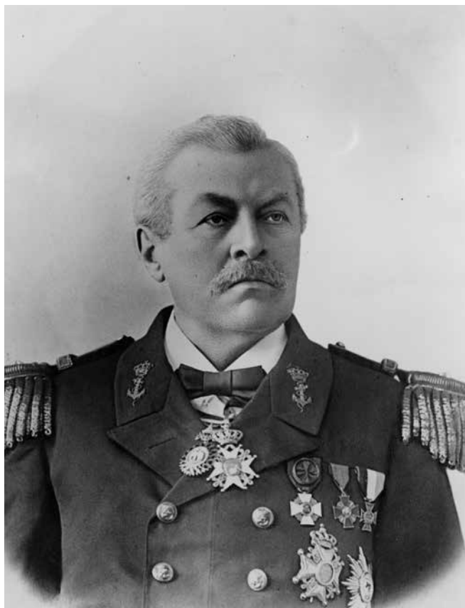
Portret van de minister van Marine G. Kruys