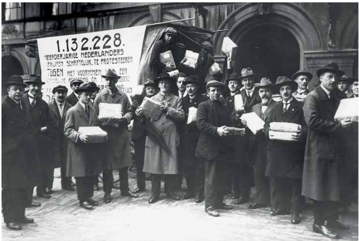
SDAP en NVV bieden petitie van ruim 1.132.000 Nederlanders aan op het Binnenhof, Den Haag, 1923

Na de anti-Vlootwetdemonstratie gingen duizenden actievoerders van NVV en SDAP op pad om landelijk handtekeningen op te halen voor het volkspetitionnement tegen de Vlootwet. De petitie kende een deadline; alle handtekeningen moesten op 8 oktober binnen zijn. 27 Er was zo weinig tijd voor dit voornemen dat sociaaldemocratische vrouwenclubs werden gemobiliseerd om lijsten te verspreiden en handtekeningen op te halen. De SDAP en NVV bestempelden deze inzet als een actieve daad van de vrouw tegen het militarisme. 28 In totaal waren er 125.000 lijsten in A4-formaat gedrukt met de oproep: 'Aan de Tweede Kamer der Staten-Generaal. Ondergetekenden alle meerderjarige inwoners van Nederland verzoeken u het ontwerp-Vlootwet 1924 te verwerpen'. 29