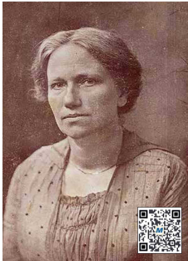
Portret van Suze Groeneweg als eerste vrouwelijke Kamerlid, 1918

Colijn volgde De Geer op als minister van Financiën. Ruijs de Beerenbrouck vond hem de aangewezen persoon om zowel de bezuinigingen van 120 miljoen als de Vlootwet door te voeren. Bij het aanvaarden van zijn post eiste Colijn een onmiddellijke bezuiniging van tien procent op alle departementen, behalve één; vanwege de Vlootwet was het Ministerie van Marine uitgezonderd. De bewindsman opperde het dubbele percentage te besparen op het Ministerie van Oorlog. 21 De vlootmodernisering moest er komen, maar stuitte op hevig weerstand van politiek links. Evenals De Geer vonden tegenstanders het onbegrijpelijk dat er in tijden van bezuinigingen zo veel geld werd geïnvesteerd in de vloot. Het aftreden van De Geer maakte de SDAP alert. In de pers was er geen ruimte voor begrip of nuance. Ruijs de Beerenbrouck meende inmiddels dat een extra miljoen gulden op de marinebegroting geen bezwaar zou zijn. Het socialistische dagblad Het Volk zag dat anders en stelde voor een nationale betoging in september te gebruiken om het verzet tegen de Vlootwet te bevorderen. De toon was gezet. De aandacht van de SDAP richtte zich daarbij vooral op de houding van de katholieken. Nadat argumentatie als internationale spanningen en buitenlandse militaire dreiging voor de urgentie van een nieuwe vloot na onder meer de Washington Vlootverdragen minder wogen, beseften de sociaaldemocraten dat