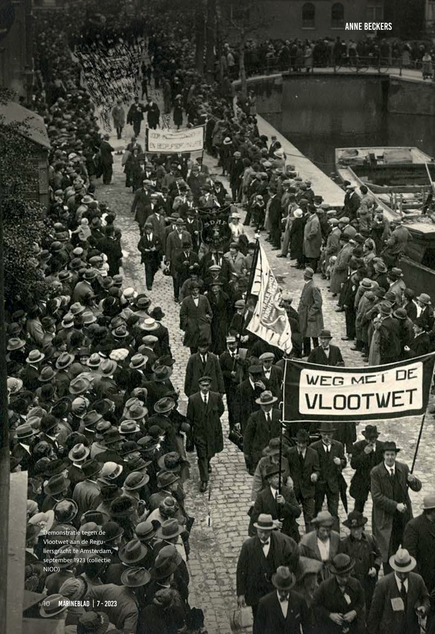
Demonstratie tegen de Vlootwet aan de Reguliersgracht te Amsterdam, september 1923