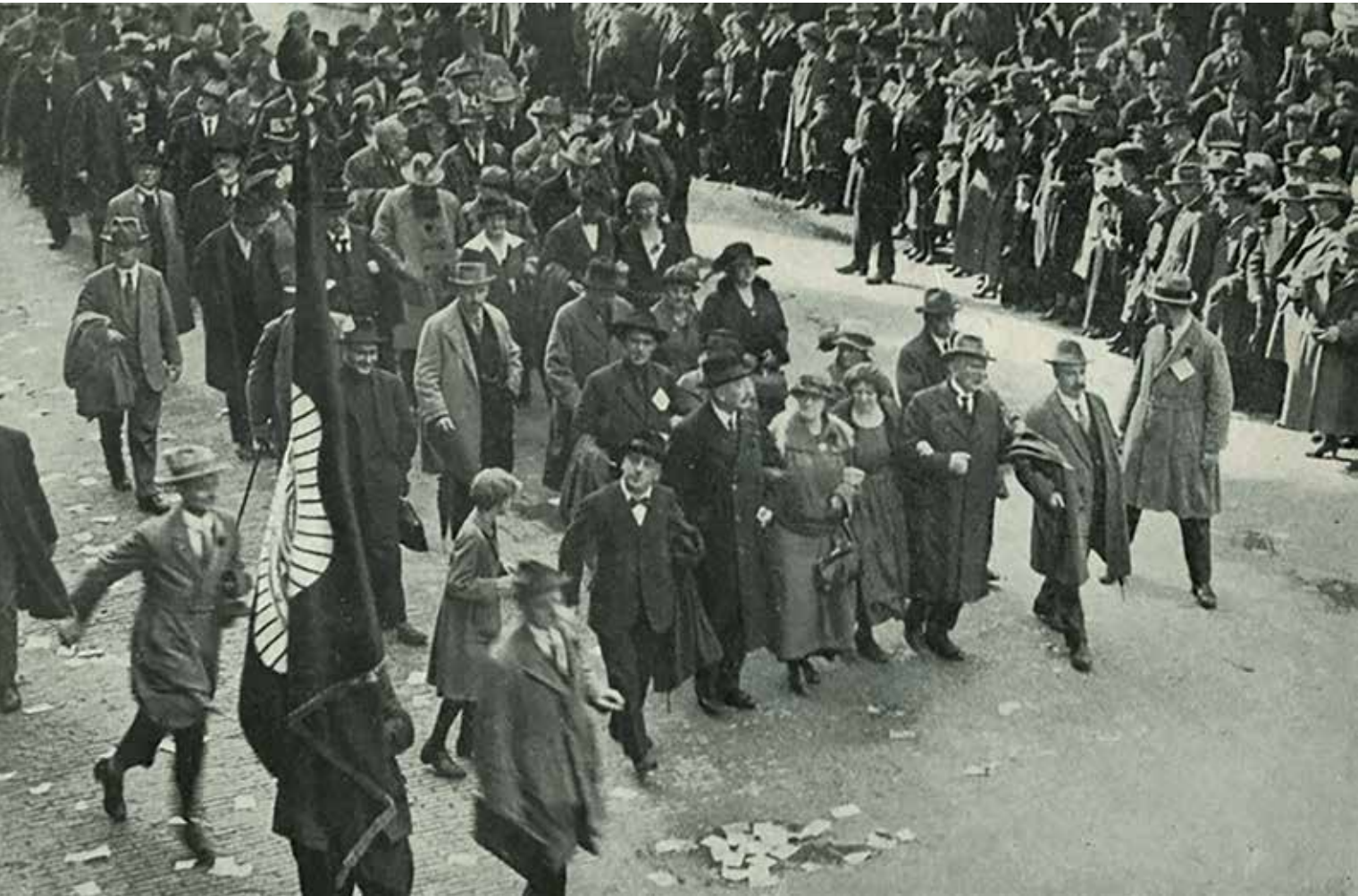
Vrouwen voorop in de strijd tegen de Vlootwet, 23 september 1923

de oppositie mee. De gehele oppositie in de Tweede Kamer stemde tegen. En één Kamerlid had dit alles kunnen voorkomen, maar kwam niet opdagen. Het betrof CHU-Kamerlid Bartholomeus Gerretson, die voor zou stemmen, maar deze was vanwege ziekte afwezig. Het tweede kabinet-Ruijs de Beerenbrouck diende diezelfde avond van 26 oktober nog bij koningin Wilhelmina zijn ontslag in. 37