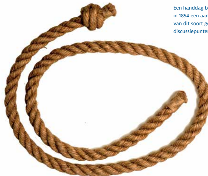
Een handdag bestaande uit drie strengs. Toen de marine in 1854 een aantal lijfstraffen verzachtte, was de dikte van dit soort geselinstrumenten een van de belangrijkste discussiepunten

Het debat spitste zich toe op de vraag of lijfstraffen als een oplossing of probleem gezien konden worden. Tegenstanders van lijfstraffen probeerden vooral de problema-