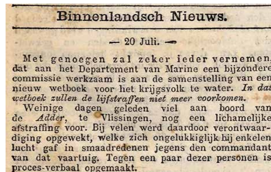
Terwijl het incident op Zr.Ms. Adder tot onrust leidde in de Nederlandse samenleving, kon het Ministerie van Marine iedereen geruststellen met de aankondiging van een nieuw strafstelsel