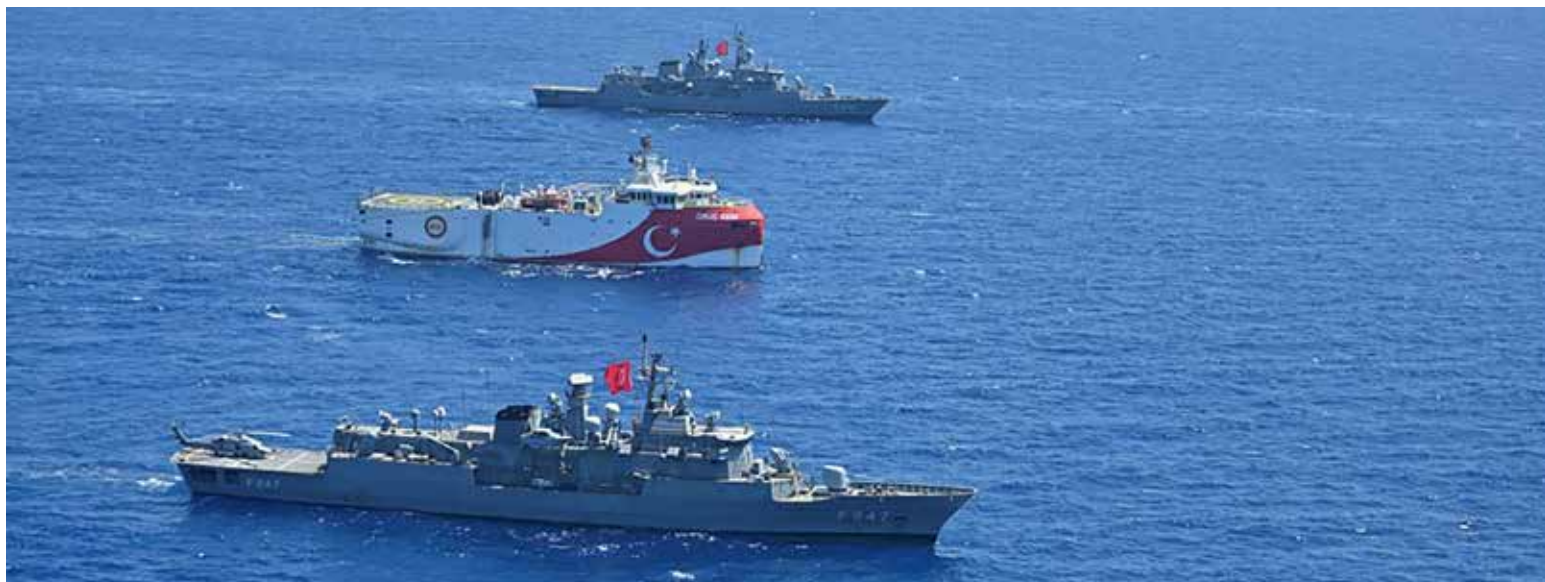
Turks onderzoeksschip Oruç Reis vaart in de buurt van Cyprus onder escorte van Turkse oorlogsschepen

november vorig jaar gezet door Turkije. In november 2019 maakte Turkije met Libië afbakeningsafspraken. 13 Deze werden onder meer ingegeven door een door Ankara ervaren isolatiestrategie over de wateren door andere landen in de regio. 14 Volgens Griekenland houdt de zone die Turkije daarmee beoogt geen rekening met de rechten op maritieme zones die de Griekse eilanden in datzelfde gebied genereren. Griekenland beschouwt de afspraak tussen Libië en Turkije als niet bindend voor Griekenland. Desalniettemin werd als tegenreactie in 2020 de Turkse stap gevolgd door een Griekse. Een afbakeningsovereenkomst met Italië werd in juni vastgelegd 15 en begin augustus tekende Griekenland een afbakeningsafpraak met Egypte. De beoogde strook die uit deze afspraak voortkomt, overlapt met de EEZ die tussen Libië en Turkije is vastgelegd. Zo hebben beide landen afbakeningsclaims die ze van elkaar niet erkennen. Ook Syrië liet van zich horen door in een brief aan de VN de Turkse afspraken niet te erkennen en te menen dat de afspraak politieke en juridische implicaties zal hebben voor een toekomstige afbakening van maritieme grenzen tussen Syrië en Turkije. 16